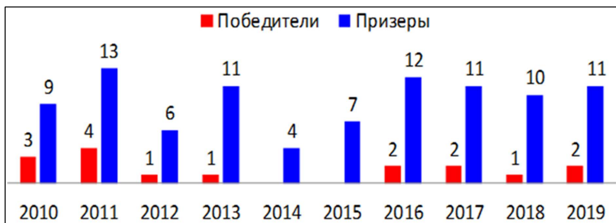
Рис. 1. Количество победителей и призеров заключительного этапа ВсОШ от Саратовской области